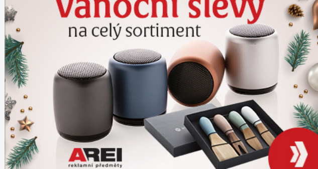
Kreativa od Seznamu